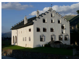
Vorbildliche Restaurierung in Sa Punt