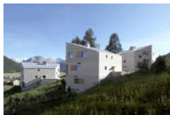
Mehrfamilienhäuser Crusch, (2011) Arch. Hans-Jörg Ruch