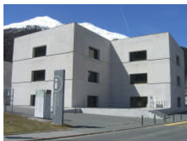
Besucherzentrum Nationalparks in Zernez, Arch. Valerio Olgiati.