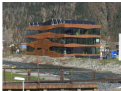
Moderner Gewerbebau in Samedan