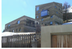
Wohnüberbauung Giardin 2007, Arch. Lazzarini