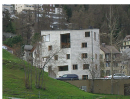
Mehrfamilienhaus Hans-Jürg Buff, 2009, Arch. Pablo Horvarth

6 (!) Wohnungen für den Architekt und einige Freunde.