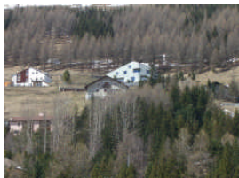
Symbiose von neu und alt vor Zuoz