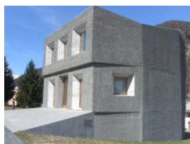
neues Ausstellungsgebäude in St. Maria i. Münstertal