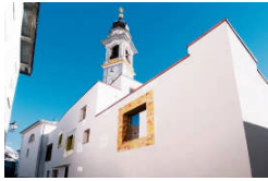
Badhaus am Dorfplatz, Arch. Miller+Maranta, 2009