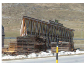
Mehrzweckgebäude in S-Chanf mit verschiedenen Nutzungen