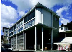
Schulhaus der Academia Engiadina, Arch. Giuliani.Hönger, 1997