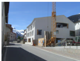
Neues Schulgebäude in alter Form in Taufers i. Münstertal